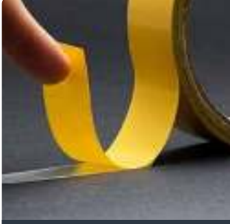
ÇİFT TARAFLI BANT