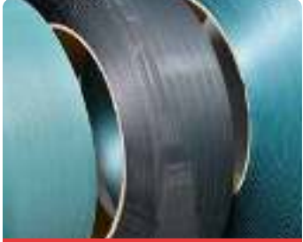
Polyester Çember (PET)