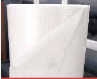
ARA KALİTE BALONLU NAYLON