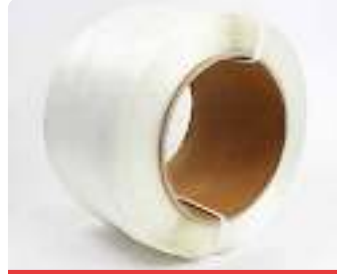
Lifli Kompozit Çember